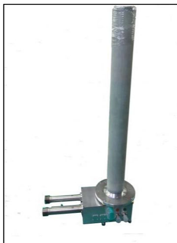
Fig.1 DNP-CP/MAS プローブ

(1)プローブ、テラヘルツ波発振器、冷却装置との接続できることを確認した。(2)ヘリウムガス、及び窒素ガスフローのそれぞれの実験条件にて、照射パルス強度を測定した。HFチャンネル、LFチャンネルとも60kHz以上のRF強度を照射することができた。結果として、 ^{13}\text{C} CP/MASスペクトルを得ることができた。(3)ガスフロー式の冷却装置とプローブを組み合わせて試料の冷却実験を実施し、試料温度が20 Kであることを確認した。(4)ヘリウムガスと窒素ガスのそれぞれのガスフロー環境にて試料回転が可能であることを確認した。ただし、試料回転周波数が十分ではない場合があった。(4)テラヘルツ波を低温試料に照射できることを確認した。(5)これらの結果として、室温時に比べて500倍相当の感度向上した ^{13}\text{C} スペクトルを得ることができた。